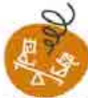
scavi in corso