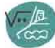
PORTA DEI SOGNI NELLA SCIENZA