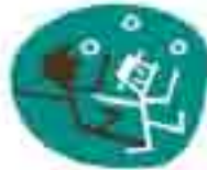
TEATRO DEI COLORI