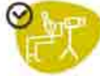
MASAZZINO DEL TEMPO